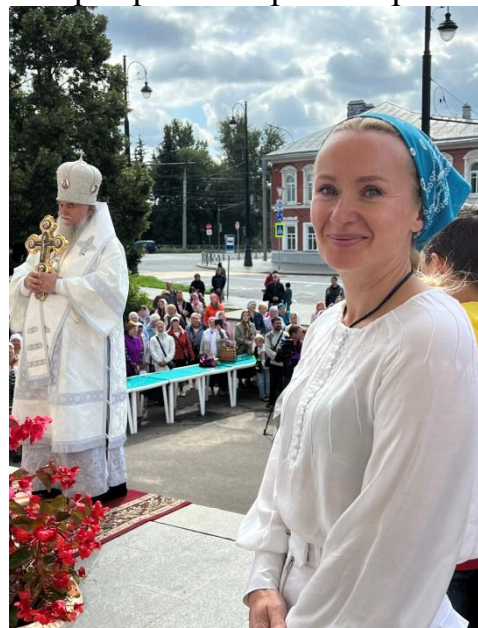
Приветственные слова от организаторов выставки в рамках церемонии открытия.

В этот же день - 19 августа - в рамках празднования праздника Преображение Господня была совершена Божественная Литургия епископом