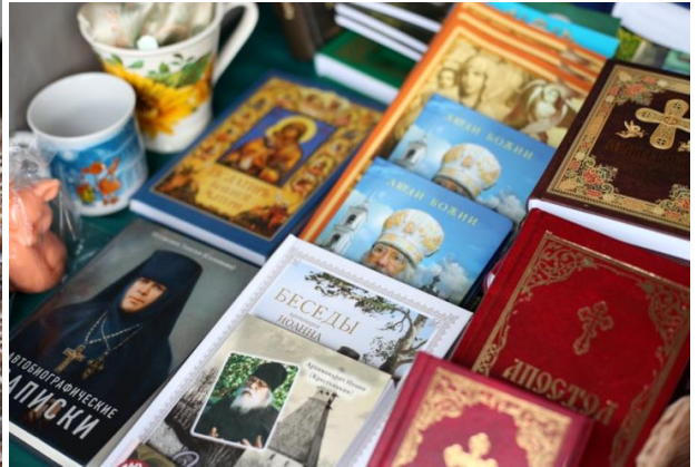
Участники православной выставки-ярмарки «Мир и Кликр»