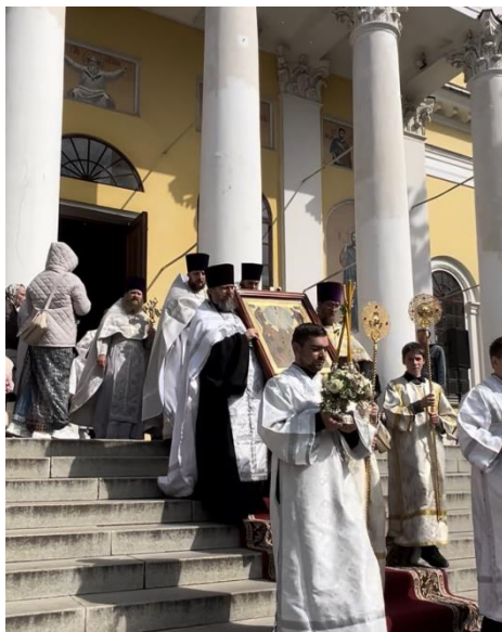
Крестный ход в честь праздника Преображения Господня

Рыбинским и Романово-Борисоглебским Вениамином. Священнослужители и прихожане прошли крестным ходом вокруг Спасо-Преображенского собора, затем прошло освещение плодов нового урожая.