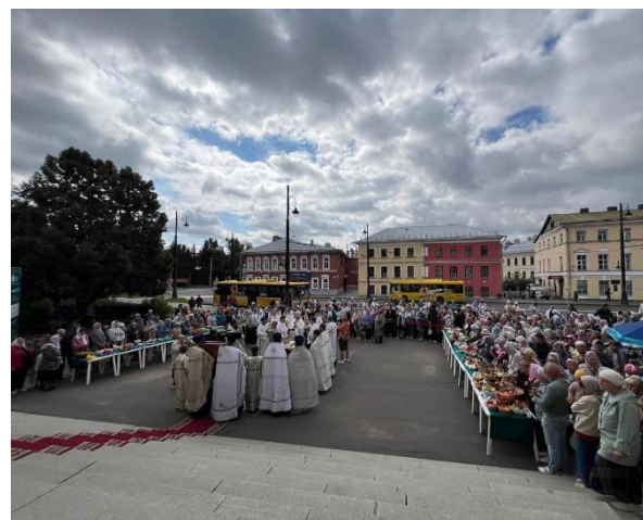
Молебен на освещение плодов в рамках празднования праздника Преображения Господня